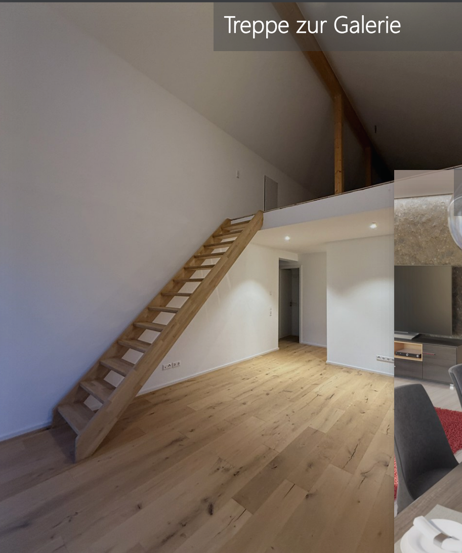
Treppe zur Galerie