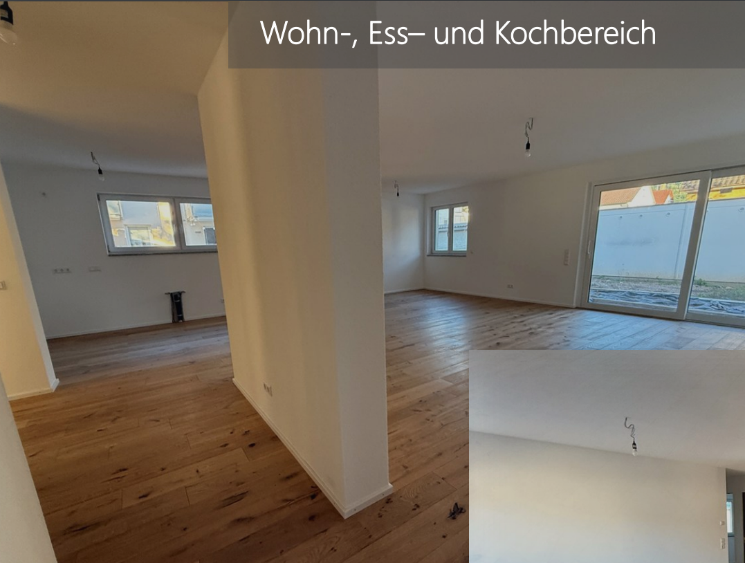
Wohn-, Ess- und Kochbereich